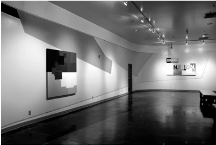
Grand Junction, Bakersfield Art Museum, December 2010.