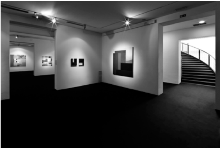
CAMeC, La Spezia, 2010.