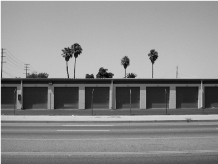
Los Angeles, February 18, 2008.