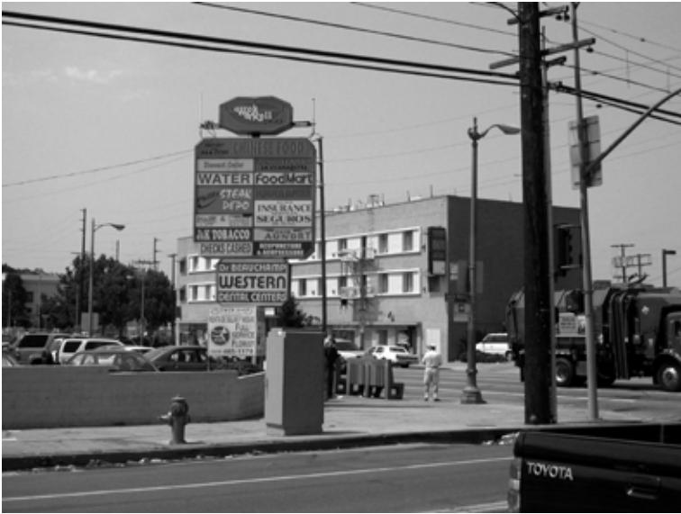
Hollywood, May 7, 2009.