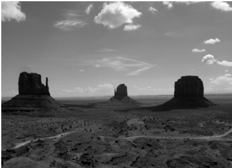
Monument Valley, May 17, 2008.