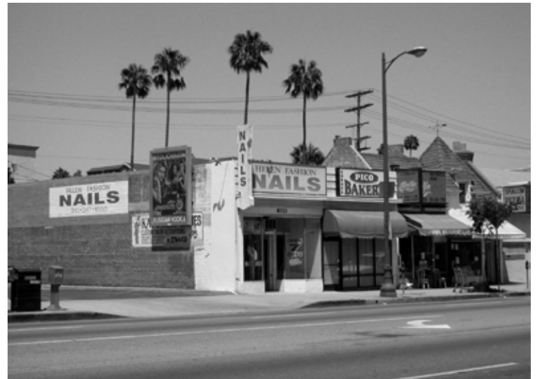
Los Angeles, May 17, 2008.