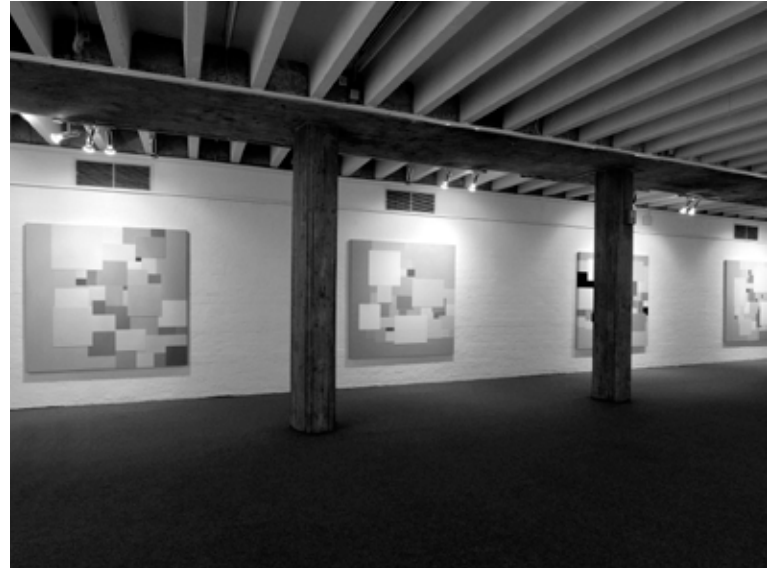
Museum fur Konkrete Kunst, Ingolstadt, February 18, 2008.