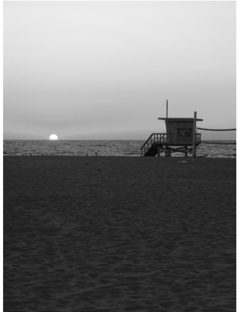
Sunset at Hermosa Beach.